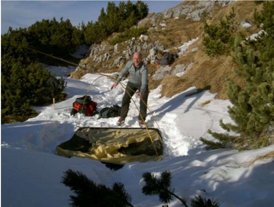
Hier nochmal der Blick zurück zum Zelt.