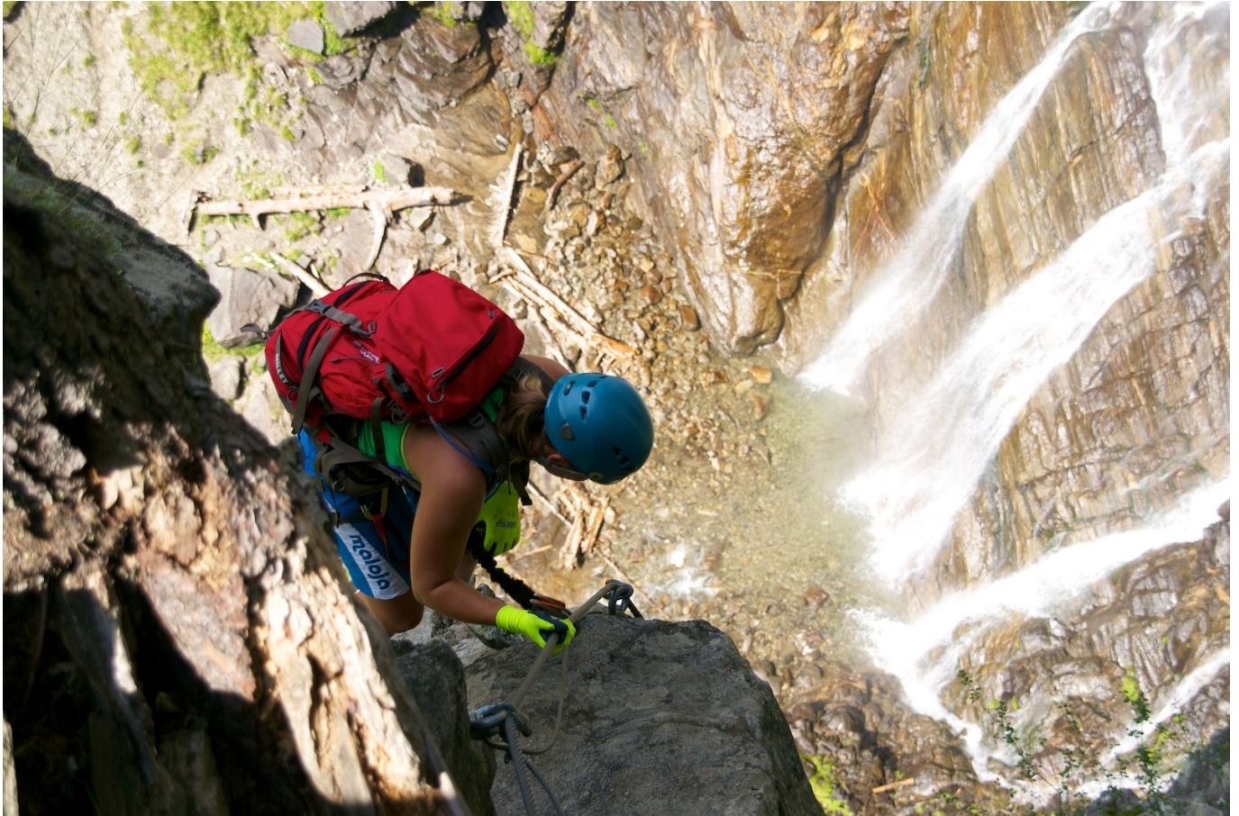
Eva kurz vor der Kanzel, wo wir eine kurze Pause machten.