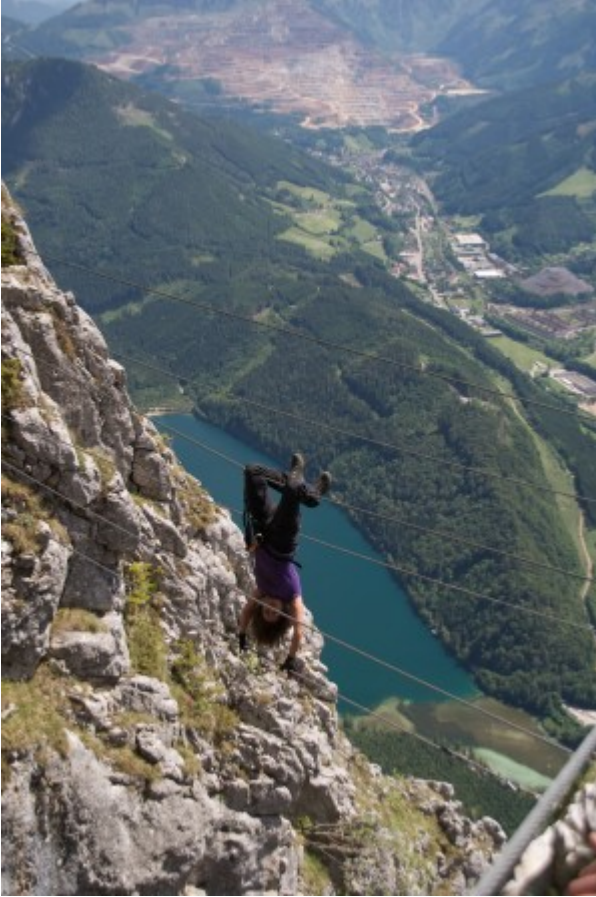
Assi nach Ausstieg des KFJ-Steiges, im Hintergrund der Pfaffenstein .