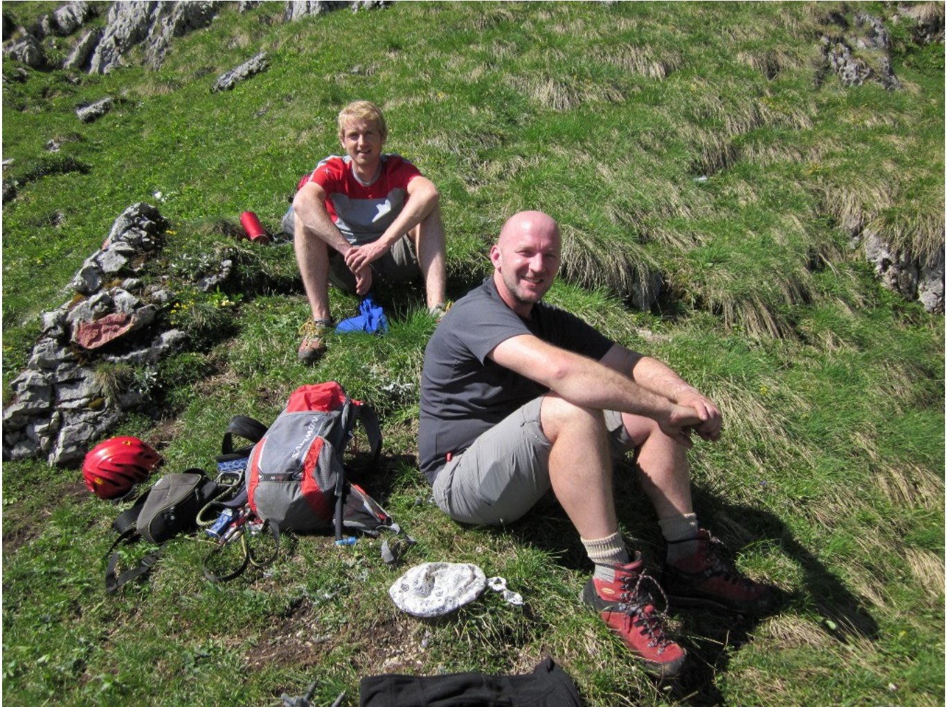
Beim Abstieg, im Hintergrund der Erzberg .