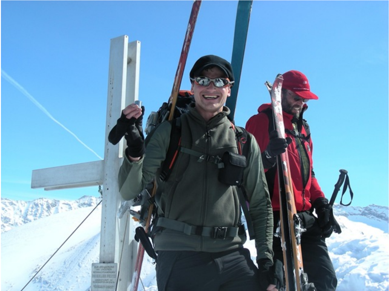
Vom Gipfel hat man einen herrlichen Ausblick Richtung Zillertaler (hier im Bild der Olperer )